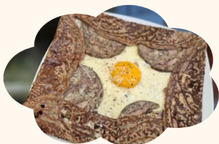
CREPERIE BLEU MARINE

28 RUE ARISTIDE BRIAND, 22000 SAINT-BRIEUC